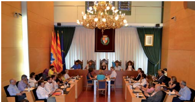
Imatge del darrer ple abans de les vacances d'estiu

Els càrrecs de confiança van ser la qüestió més controvertida del ple del cartipàs de la darrera setmana de juliol a Badalona i finalment es va poder desencallar. El govern va posposar-ne la votació i els grups de l'oposició van bloquejar, com a resposta, la creació de les comissions informatives i el nomenament dels membres de l'empresa Marina Badalona. El govern municipal havia proposat que els 27 treballadors eventuais que contractessin es repartissin de la següent manera: onze assessors de govern, set coordinadors de districte i nou assessors per als grups