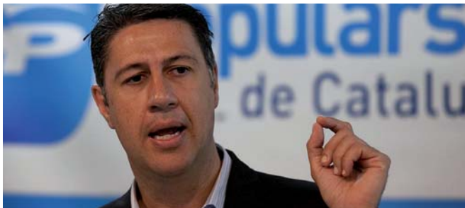
Imatge de Xavier Garcia Albiol, candidat del PPC del 27S

Alicia Sánchez-Camacho no serà la candidata del PP a les eleccions del 27 de setembre. La rellevarà el badaloní Xavier García Albiol, que tindrà de número dos Andrea Levy, vice-secretària d'Estudis del PP català i promocionada fa poc per Rajoy amb el càrrec de vice-secretària d'Estudis i Programes del PP espanyol. Ho ha explicat Camacho en una compareixença, en la qual ha volgut deixar clar que ella continuaria com a presidenta del partit fins al congrés del 2016. Alcalde de Badalona entre el 2011 i el 2015, García Albiol va perdre el govern aquest mes de maig passat, quan Badalona