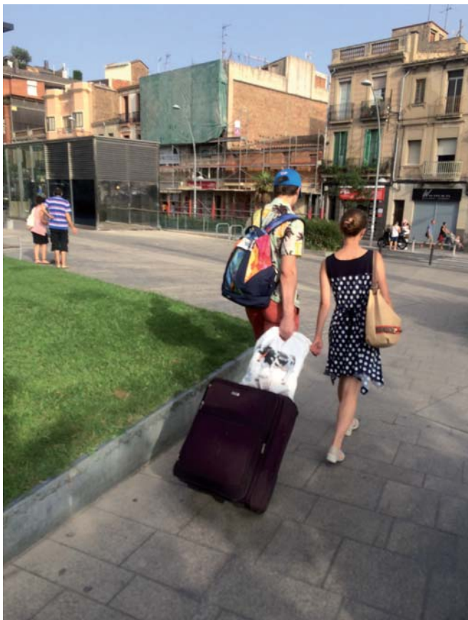
Uns turistes amb les seves maletes a la plaça Pompeu Fabra aquesta setmana

Platja, tranquil·litat i bona connexió amb Barcelona. Aquests són els atractius que pot presumir Badalona com a ciutat turística. Cada vegada és més la gent de fora que escull visitar la ciutat durant les seves vacances. Aquest estiu l'ocupació als establiments hotelers badalonins ha estat gairebé total durant els mesos de juliol i agost, destacant sobretot el primer, que ha superat totes les previsions que havien fet els hotelers i fins i tot en dies puntuals s'ha arribat al 90% d'ocupació. Els responsables dels hotels de Badalona han destacat que s'han superat les dades de l'any passat durant els mesos d'estiu. Els hotelers tornen a recordar que el millor que pot vendre la ciutat són les seves platges i sobretot la connexió amb la ciutat de Barcelona on els turistes s'hi passen gran part del dia. De fet, molts d'aquests turistes que venen a Badalona només ho fan per dormir.