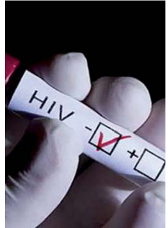
L'hospital badaloní avala el medicament preventiu contra la sida

A l'Estat es registren anualment 3.500 nous casos de sida. D'aquests, al voltant de 700 són a Catalunya. El 0,02% dels casos afecten la població en general i el 2,5%, l'homosexual. Aquest col·lectiu continua sent un dels grans afectats per la sida ja que de cada 10.000 persones heterosexuales se n'infecten dues cada any, mentre que de cada 10.000 homosexuals són 250 els