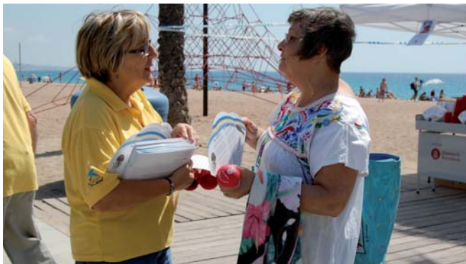
Una voluntària oferint informació a la platja de Badalona