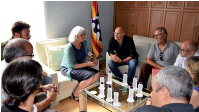
Dolors Sabater amb Raül Romeva, aquest dilluns al despatx de l'alcaldesa