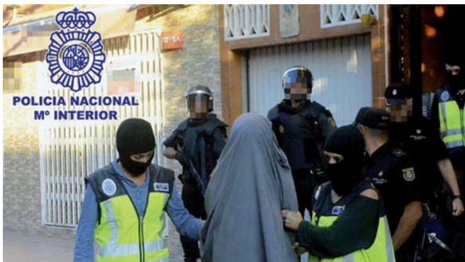
Imatge de l'operació del passat diumenge.

Nova detenció d'un presumpte jihadista a Badalona. Un jove, d'uns 20 anys, i veí del barri de la Salut, va ser detingut diumenge al matí per estar vinculat a una xarxa d'Estat Islàmic. L'operació, entre la policia nacional i la policia marroquina, va detenir 9 persones més, a Toledo, València i a Casablanca, al Marroc. El detingut al Grup Verge de la Salut és un jove d'uns 20 anys d'origen magribí nascut a Catalunya que vivia amb la seva mare, qui va patir diumenge al matí una crisi d'ansietat, com a conseqüència de la intervenció policial i va ser atesa per un equip mèdic. La dona va explicar que fa 30 anys que viu a Catalunya, que és mare de quatre fills i que el detingut és el més petit d'ells. Alguns veïns van explicar que la detenció es va produir durant la matinada, que en l'operació van intervenir nombrosos policies i que sobre les 7 del matí els agents encara treien caixes