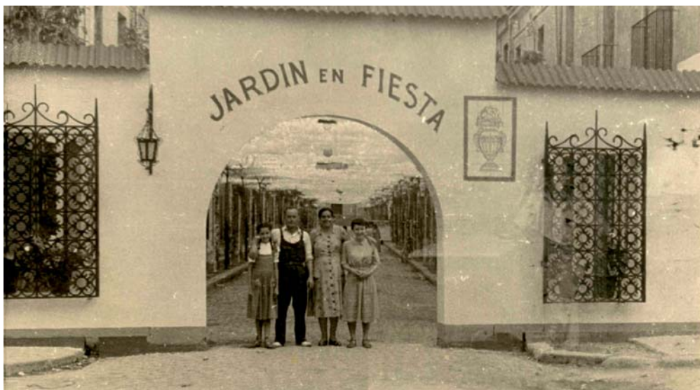
La família Noll Forcadell a l'entrada del carrer Roger de Flor, durant la Festa Major, any 1952.

Per col·laborar amb aquesta secció pot enviar la seva foto antiga a: badalona@eltotbadalona.cat