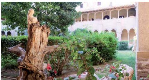
Monestir de Sant Jeroni de la Murtra, aquest dimarts