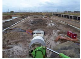
Obres al futur canal del Port, la setmana passada

aprofundir en el contingut del projecte. El regidor de l'Àmbit de Badalona Habitacle, Oriol Lladó, va dir que “el projecte de la rambla del Gorg i del canal del Port és estratègic per a Badalona i aquest Govern el vol seguir tirant endavant comptant amb l'opinió de tot el veïnat per millorar aquelles qüestions que es puguin canviar” . “Volem un port obert a la ciutat, que els veïns i veïnes se'l sentin seu i que estigui millor connectat amb la resta de Badalona” , va afegir. El regidor de l'Àmbit Badalona Habitacle també va explicar que “un cop feta la visita sobre el terreny i la sessió informativa, ara els representants veïnals