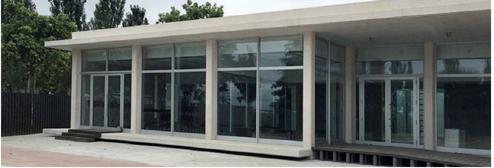
Nou tanatori de Montgat.