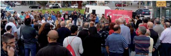
Imatge de l'assemblea ciutadana de Guanyem Badalona en Comú