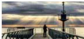
Al final del pont. #Badalondia #Badalona @badalondia

Q dos "personatges", avui a les 6 d la tarda li robin en el teu fill el mòbil, a la Pza Dr Robert d #Badalona: inseguretat @Josepsancho7