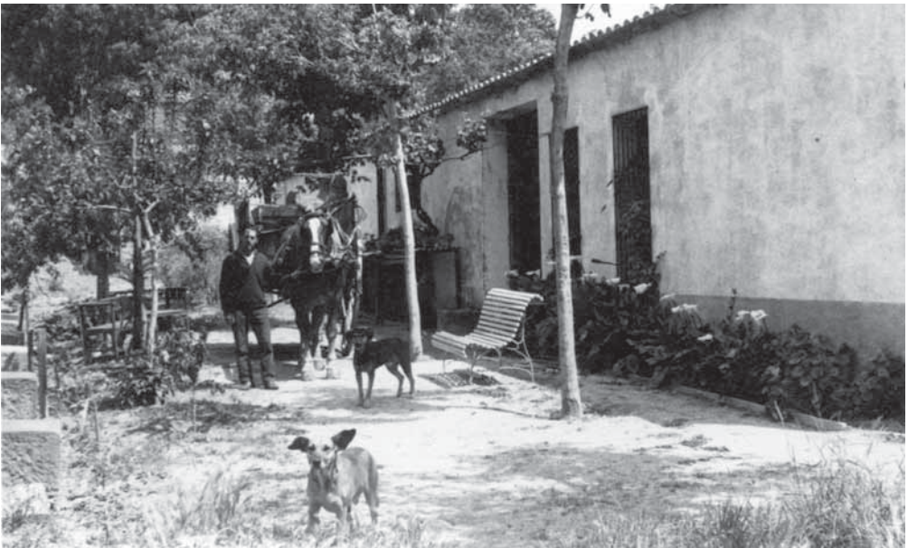
Casa pairal al Mas Ram. Any 1950. Residents senyors Periz.

Per col·laborar amb aquesta secció pot enviar la seva foto antiga a: badalona@eltotbadalona.cat