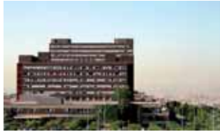
Els ajuts fomenten la continuïtat de professionals acabats d'especialitzar

Els Ajuts Germans Trias Talents, creats l'any 2012 per Germans Trias i Fundació Catalunya-La Pedrera, van celebrar dimecres la seva quarta edició amb més de mig milió d'euros invertits per promoure la continuïtat dels joves talents. Finançats amb el suport de tres companyies farmacèutiques, els ajuts es destinen a fer viable un projecte de recerca presentat per joves professionals que acaben la seva etapa d'especialització sanitària. És així com s'aconsegueix que puguin continuar plenament vinculats a Germans Trias, on es procura que també puguin desenvolupar activitat assistencial. Enguany, la convocatòria s'ha ampliat a l'Atenció Primària de l'Institut Català de la Salut (ICS) a l'àrea Metropolitana Nord, on s'han especialitzat dos dels onze premiats per primera vegada en aquesta edició. També, set professionals més, ja guardonats l'any passat, han