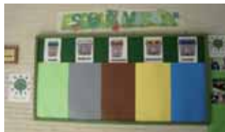
Badalona compta amb sis escoles més amb el distintiu

Sis escoles de Badalona han obtingut recentment el distintiu d'Escoles Verdes. Es tracta del Col·legi Badalonès, l'Escola Jungfrau, l'Escola Lola Anglada, l'Escola Pau Picasso, l'Escola Salvador Espriu i la Secció d'Institut