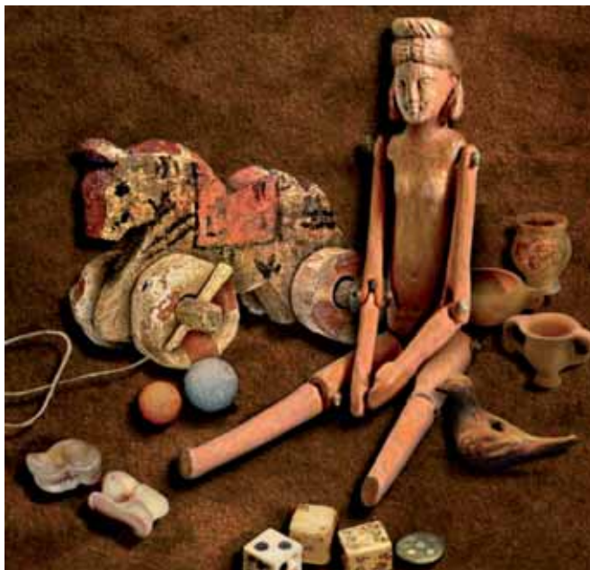
Algunes de les joguines que s'exposen a l'exposició "Jocs i joguines a l'Antiguitat"

El Museu de Badalona acaba d'estrenar l'exposició "Jocs i joguines a l'Antiguitat", una mostra que ens permetrà descobrir com el joc ha estat una eina de diversió i d'aprenentatge que acompanya l'home des de fa mil·lennis. Locus és el terme llatí que els romans utilitzaven per referir-se al joc, a la diversió, a l'activitat de passatemps. La necessitat social de jugar, al segle XXI, es manifesta en suports digitals, però alhora també es mantenen alguns dels jocs que van inventar els nostres avantpassats. El io-io, la pilota, les bales o la baldufa tenen els seus orígens en cultures molt antigues com l'egípcia, la grega o la romana, i encara ara continuen essent una bona excusa perquè nens i nenes comparteixin una bona estona de diversió. L'exposició recull unes 130 peces arqueològiques, procedents de 13 museus de Catalunya. L'exposició es completarà amb