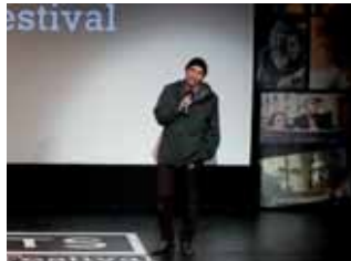
Imatges de dos moments de la Nit de les Venus de Filmets