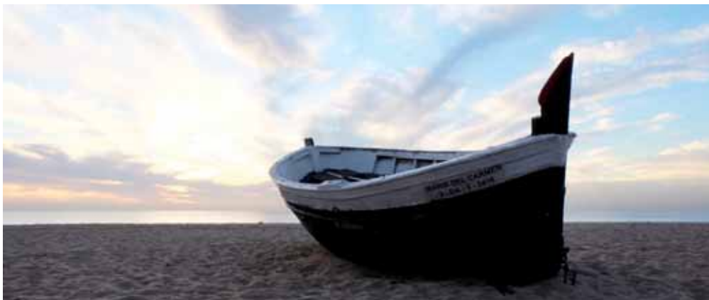
Imatge de les barques situades a la platja dels Pescadors