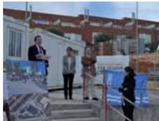
Imatge de la primera pedra del Mercat de Montgat

El passat cap de setmana va tenir lloc l'acte de col·locació de la primera pedra del Mercat de Montgat, un fet simbòlic a través del qual han quedat inaugurades les obres del nou mercat per a donar el tret de sortida a la comercialització dels locals que formaran part del nou equipament comercial. Al mercat hi trobarem 20 parades i locals que es complementaran amb un supermercat. Per a tots aquells comerciants que tinguin interès en poder formar part d'aquest projecte i informar-se més sobre el Mercat de Montgat i el procés