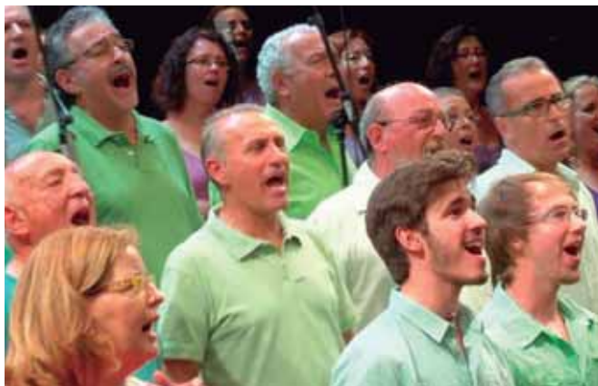
Imatge d'arxiu de la Coral Gospel Sentits de Badalona

La Fundació Acolllida i Esperança ha organitzat per aquest dissabte, 12 de desembre, la segona edició del concert solidari de Nadal. La cita enguany és a Badalona, concretament a les 20.30 hores a la Parròquia de Santa Maria. La Coral Gospel Sentits interpretarà un repertori de gospel variat i atractiu que inclourà cançons de més tradicionals, gospel contemporani i cançons del món del pop inspirades en el gospel. Clàssics com, "Joshua fit the battle of Jericho" i "I can go to god in prayer", es barrejaran amb cançons més recents com "Lord you are good" o "Revelation" i amb pop amb accent de gospel com "Walking in memphis", "Bridge over trouble watter" o "Happy". L'entitat celebra aquesta trobada nadalenca amb la voluntat de donar-se a conèixer a la ciutat de Badalona; sensibilitzar sobre les necessitats de les