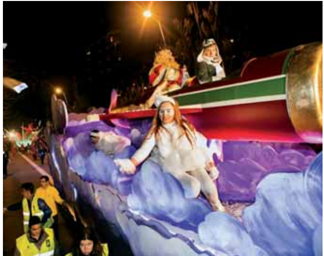
Imatge d'arxiu de la Cavalcada de Reis de Badalona

La Cavalcada de Reis del 2016 presentarà moltes novetats que ja s'han desvetllat. La que segur causarà més polèmica i comentaris a Badalona serà el llançament de caramels. L'Ajuntament ha anunciat que les 5 tones de caramels, la mateixa que l'any passat, no es llançaran fins al final de la Cavalcada amb dues carrosses dolces i una dels Mercats Municipals. El govern ha explicat dos motius per prendre aquesta decisió, una la seguretat i l'altra per poder gaudir de l'espectacle artístic de la Cavalcada i no estar pendent del llançament de caramels. De fet, la mor d'un nen a la Cavalcada de Màlaga, fa un parell d'anys, ha fet canviar en molts municipis el llançament de caramels. En algunes ciutats, com Manresa, només els Reis llencen caramels i en altres ciutats, com Rubí, han limitat el nombre de carrers on es