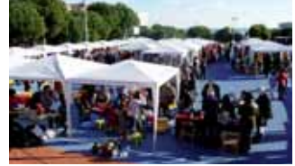
Imatge d'arxiu de la Fira de Nadal de Montgat

paradetes instal·lades per a l'ocasió; i, de l'altra, trobaran activitats, com ara una caravana de ruquets per als més petits, una granja d'animals i tallers de diferents temàtiques: de tions, de plastilina màgica i de fanalets. A més, els visitants també podran degustar brou calent i hi trobaran una foguera per fer pa torrat. Dins la programació també s'inclou la Festa de l'Aigua, un gran carrusel, una ludoteca mòbil i un tió gegant. D'altra banda, a Tiana dissabte