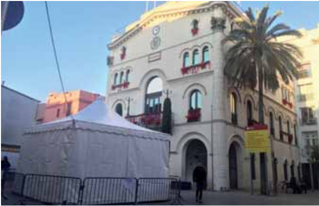
El Pessebre ha tornat a recuperar l'espai central de la plaça de la Vila