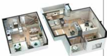
Dúplex de 2 dormitoris