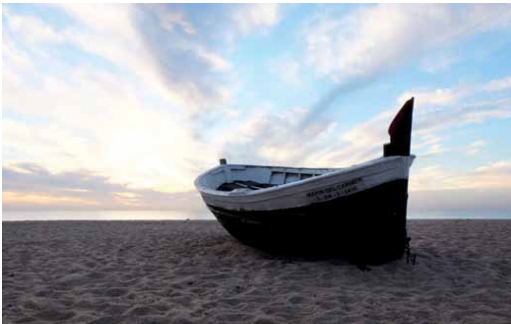
Imatge de les barques dels Pescadors