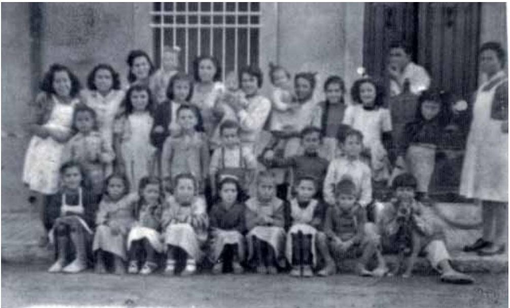
Nens i nenes del C. Alfons XII, any 1946.

Per col·laborar amb aquesta secció pot enviar la seva foto antiga a: badalona@eltotbadalona.cat