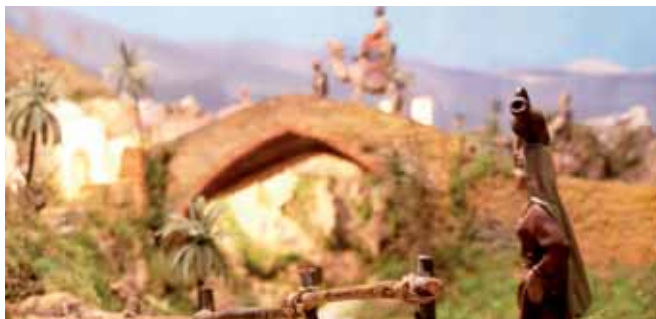
Imatges de la Mostra de Pessebres del Refugi