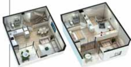
Dúplex d'1 dormitori