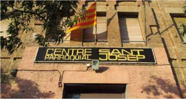
Exterior del Centre Parroquial Sant Josep