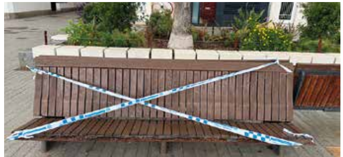
Imatge d'un dels bancs precintats

de descans en una de les zones més transitades de la ciutat.