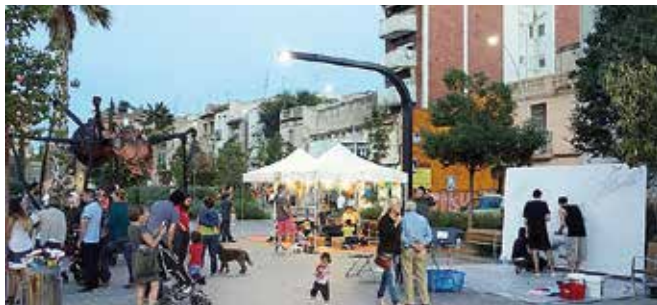
Imatge d'arxiu de la fira Connect'Art

El dissabte, 23 de novembre, torna la fira Connect'Art, durant tot el dia, a la plaça Pompeu Fabra. Aquest espai té l'objectiu de facilitar als i a les joves de Badalona l'oportunitat de donar a conèixer, exposar i promocionar els seus projectes i la seva obra. La fira constarà d'una trentena de projectes emprenedors dins del món artístic, de diferents discipli-