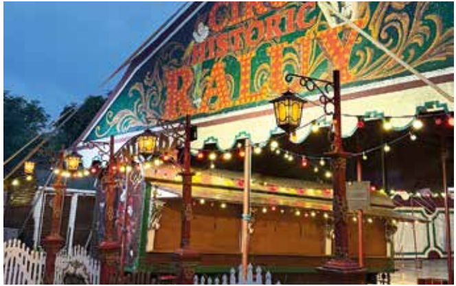
Imatge del circ històric Raluy