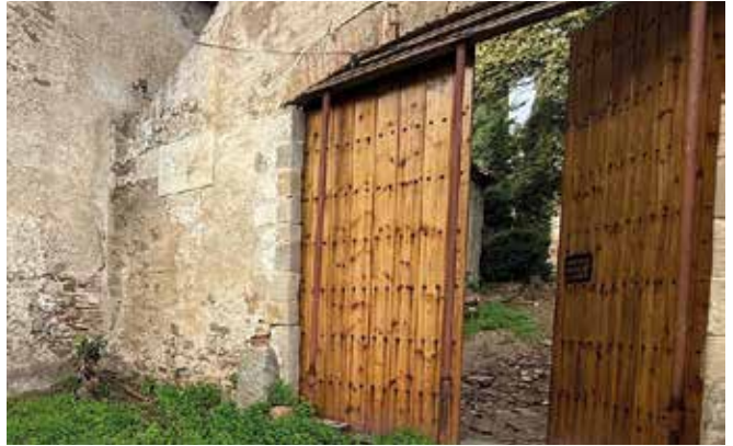
Imatge de la nova porta de Sant Jeroni

El Monestir de Sant Jeroni de la Murtra ha restaurat l'antiga entrada, recuperant un element patrimonial de gran valor per a la història del conjunt monàstic. Aquesta porta, situada a la part baixa del recinte, connecta amb les vinyes que actualment són conreades per la cooperativa Sargantana, i que aporten vida i activitat a la zona. Amb aquesta restauració, els responsables del monestir volen revalorar l'entrada original del monestir i reforçar el seu ús, convidant els visitants a accedir pel camí que antigament servia d'entrada principal. Aquesta recuperació patrimonial arriba en un any especial, ja que el 2024 es commemoren 50