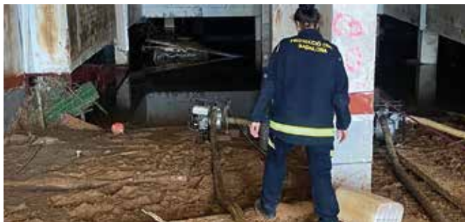
Un membre de Protecció Civil de Badalona a València