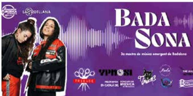
Cartell del Festival Badasona