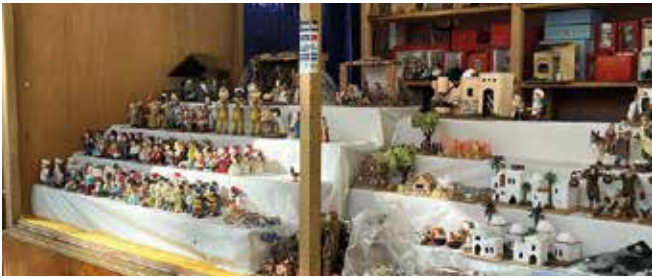
Imatge d'arxiu de la Fira de Nadal a la Plana