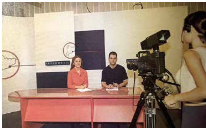
Primer informatiu de Televisió Badalona, ara fa 25 anys

La comunicació local de Badalona està d'aniversari. Aquest divendres, 14 de febrer, Televisió de Badalona celebra 25 anys d'emissions ininterrompudes com a canal municipal. Tot i que ja a principis dels anys 80 hi va haver un primer intent de televisió local, amb una emissió experimental el 1982, aquesta va ser clausurada. Més endavant, el 1985, naixia Videovisió, un projecte sorgit del Centre Cívic de Dalt la Vila que evolucionaria en Badiu Televisió. Amb sis anys de continuïtat, aquest canal es transformaria en Canal 51, fins que el 1996 va establir sinèrgies amb Ràdio Ciutat de Badalona. Finalment, el 14 de febrer de l'any 2000, Badalona recuperava la seva televisió local sota el nom de