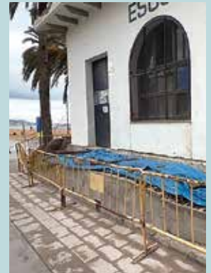
Imatge exterior del Club Natació Badalona

El Club Natació Badalona ha iniciat les obres de rehabilitació de l'espai dedicat a l'escola de vela, situat a l'antiga llotja de pescadors, a tocar del final del carrer del Mar. Les actuacions inclouen treballs a la teulada i interiors per millorar i garantir un millor servei a tots els usuaris d'aquesta instal·lació.