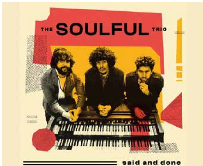
Imatge dels "The Soulful Trio"

el mític DJ Chimo Bayo, tot un referent de la música electrònica dels anys 90. L'animal de la Federació dels Tres Tombs.