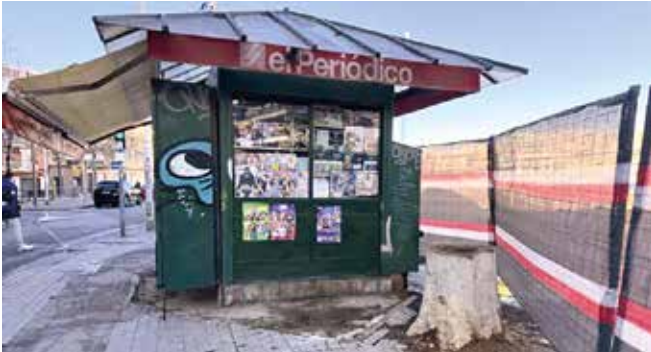
Imatge del quiosc