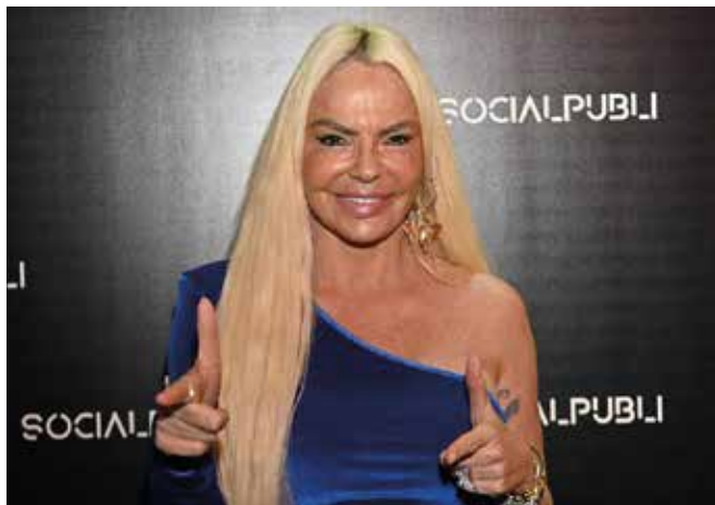
Imatge de la polifacètica Leticia Sabater

El fenomen del "tardeig" continua guanyant adeptes a Badalona, consolidant-se com una opció d'oci cada cop més popular entre els locals. Un dels espais que ha apostat fort per aquesta tendència és la sala Sarau 08911, que ja fa mesos que organitza sessions de tarda amb artistes i DJ destacats. El pròxim dissabte 22 de febrer, Sarau acollirà una festa precarnaval amb una convidada molt especial: Leticia Sabater, que promet un espectacle carregat de diversió i desinhibició. Aquest esdeveniment forma part de la programació estable de la sala, que organitza un "tardeig" cada mes. El pròxim gran esdeveniment tindrà lloc el 15 de març, amb una sessió especial protagonitzada per King África, que també